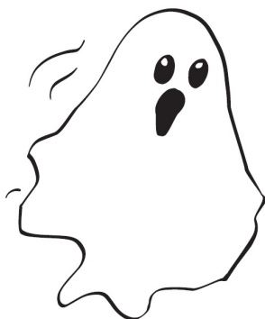
MODEL SPØGELSER I BØRNEVÆRELSET

Er der svære ting i din barndom som du er bange for indflydelse på din forælderrolle?