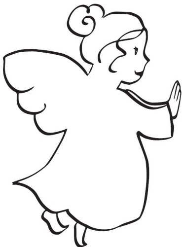
MODEL DIN ENGEL

Hvordan oplevede du rigtig gode voksne i din barndom?