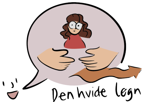
Den hvide løgn